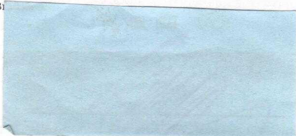
predseda rady FPU za poskytovateľa