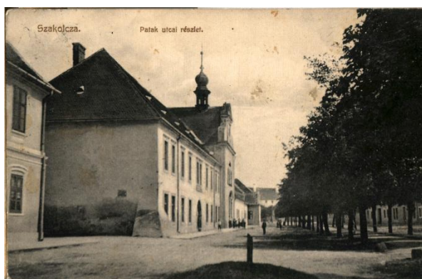
Pavlínsky kostol na Potočnej ulici v Skalici, 1915