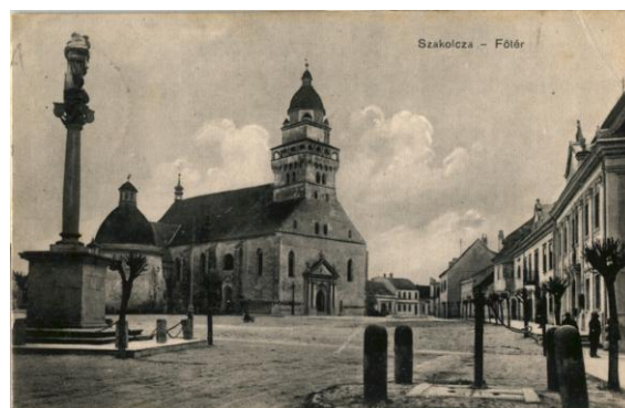
Námestie v Skalici s farským Kostolom sv. Michala a kaplnkou sv. Anny