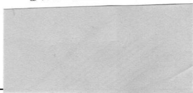
predseda rady FPU za poskytovateľa