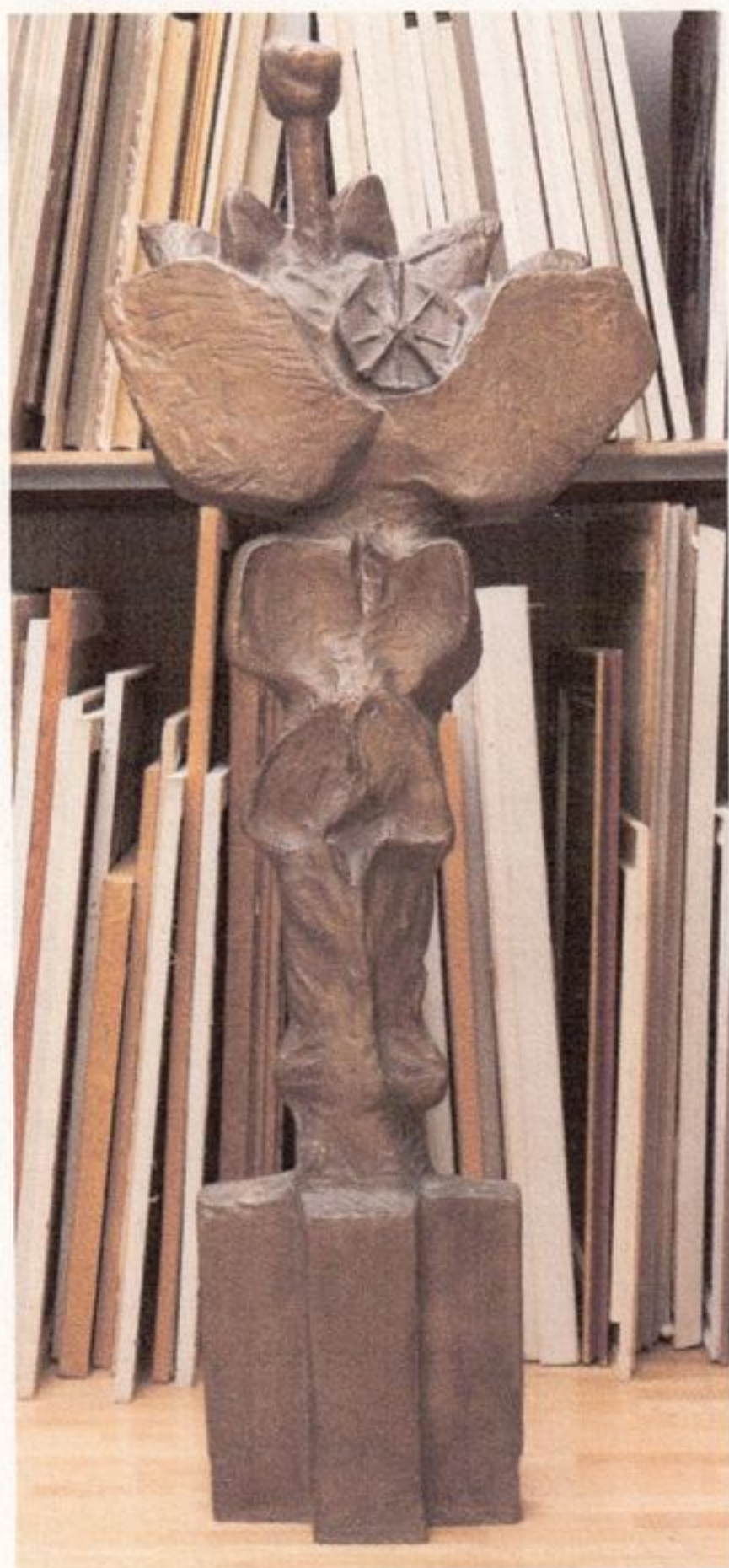
Jozef Kostka Modrý kvet. 1967, bronz, v. 195 cm S 53