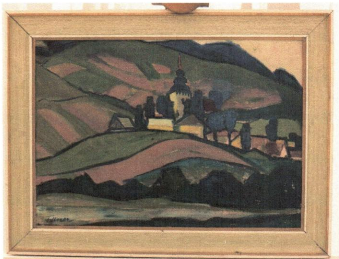
M 412 46/1988 Tillner, Michal: Liptovská Mara I., 1956, olej, lepenka, 50 x 7 cm, 797,- Eur