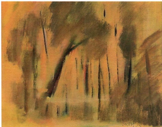
Štefan Orth: Z plenéru, 2012, uhoľ, pastel, papier, 42 x 29 cm, 300,- Eur