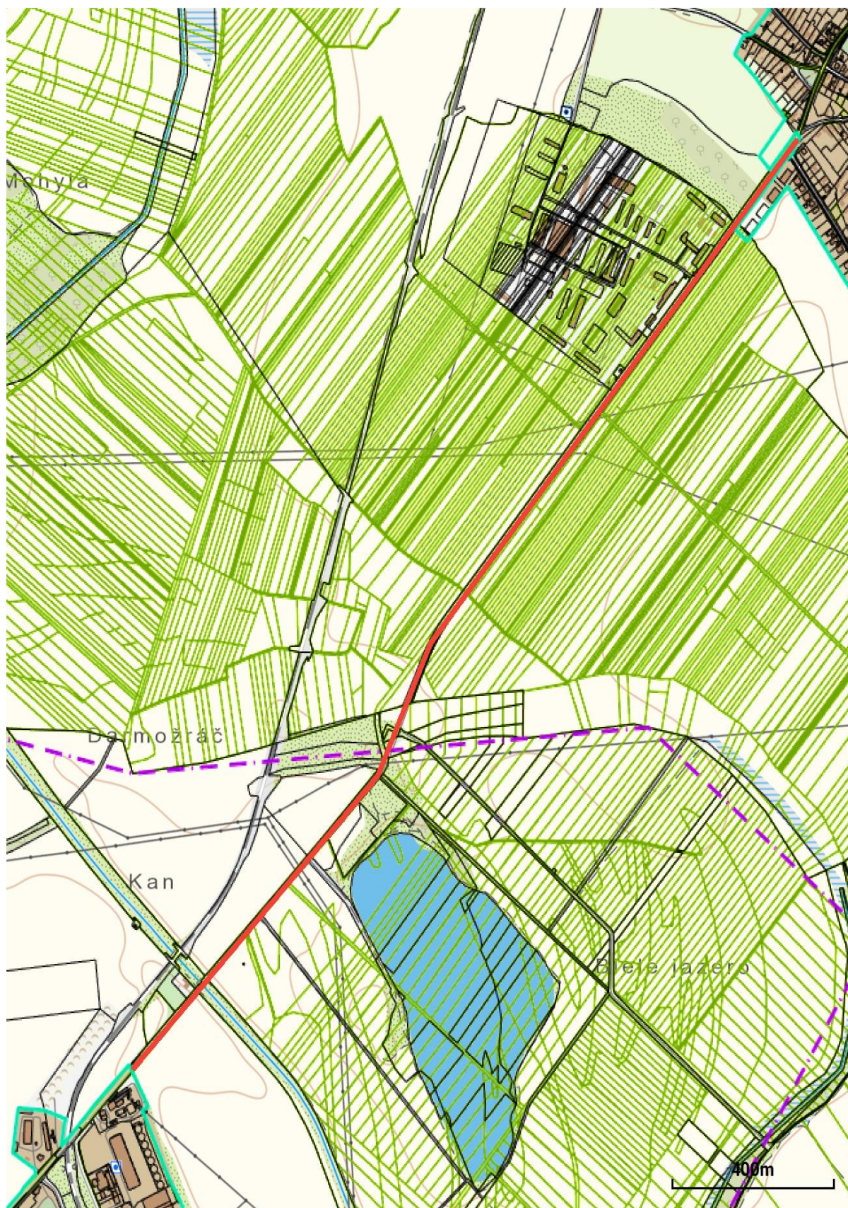
Príloha č.1 Mapa s vyznačením navrhovaného úseku cesty na rekonštrukciu.