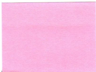
Pečiatka a podpis poisťovne