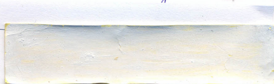
statutárny zástupca organizácie