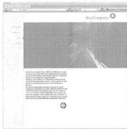
Používanie certifikačnej značky TÜV SÜD na firemnej webovej stránke.