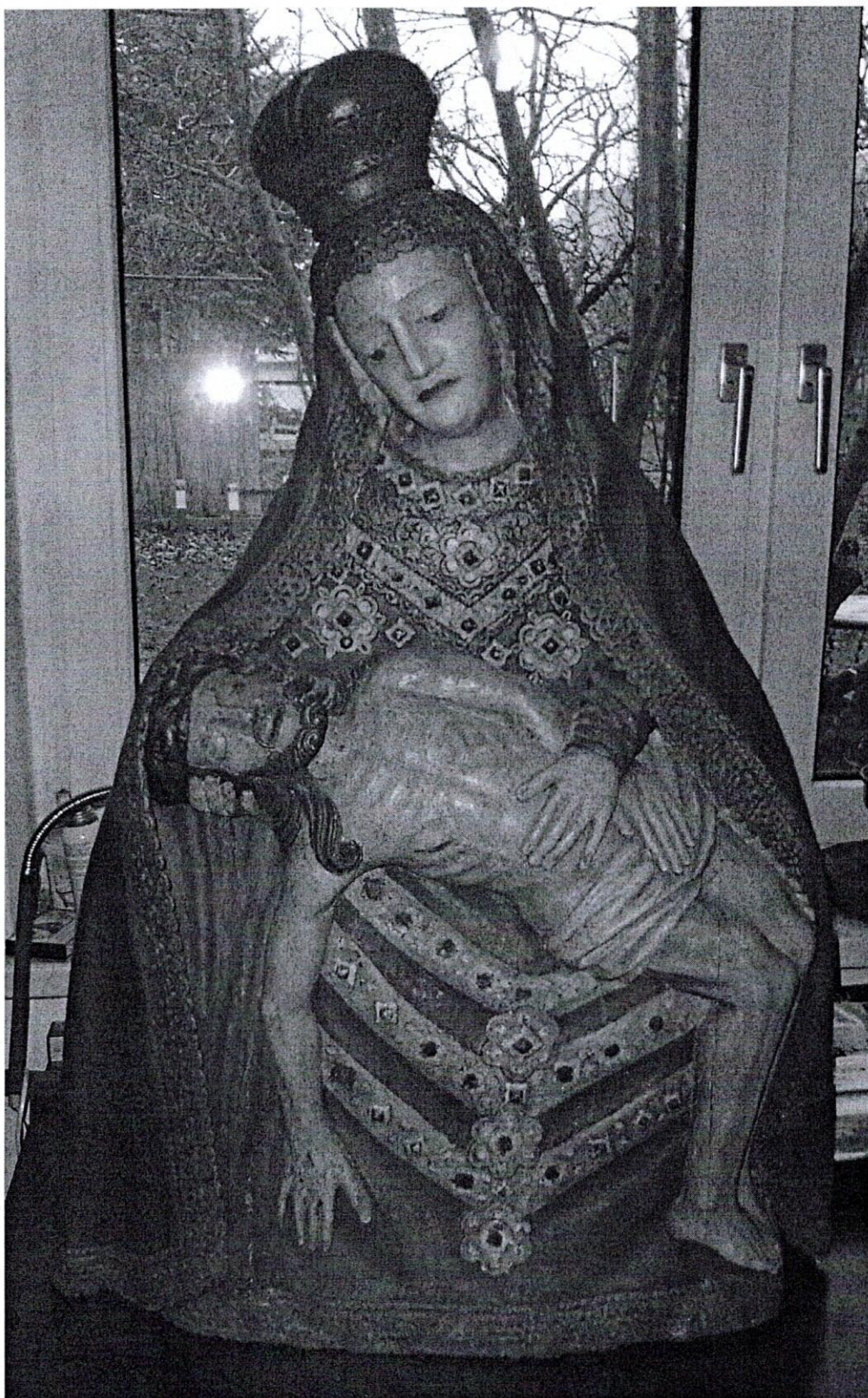
1, Pieta, pohľad spredu