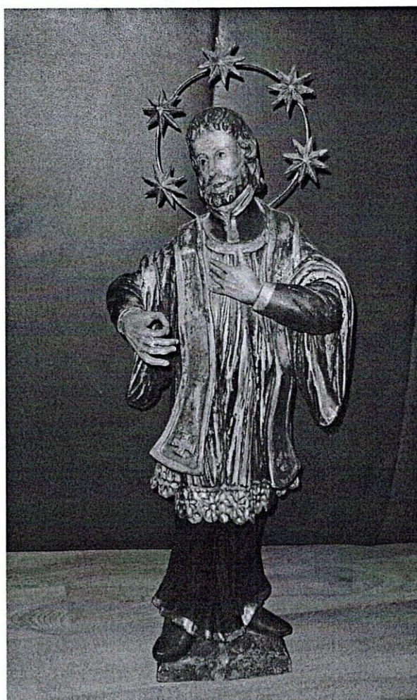
2, Sv. Ján Nepomucký, pohľad spredu