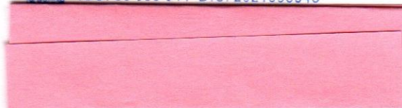
PhDr. Viera Drahošová riaditeľka Záhorské múzeum v Skalici

ZÁHORSKÉ MÚZEUM V SKALICI Nám. slobody 13, 909 01 SKALICA IČO: 36 086 941 DIČ: 2021093943